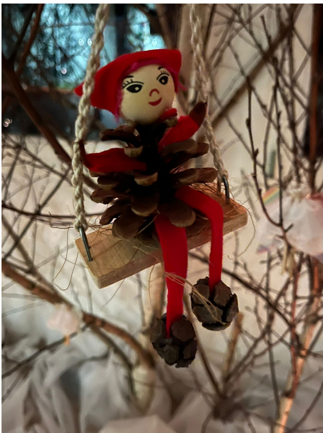
Föhrenzapfenmännchen auf Rittiplampi im weihnächtlichen Wald.

Seit den Herbstferien werkten und bastelten die Schülerinnen und Schüler der 1. bis 6. Klasse an verschiedenen Arbeiten unserer Weihnachtswerkstatt. Im Oktober schon einen Weihnachtsbaum sticken war zu Beginn etwas merkwürdig, doch die Zeit verging im Flug und es entstanden ganz unterschiedliche weihnächtliche Gegenstände, vom Wichtel mit seinem Häuschen, über fantasievolle Engel, über Skulpturen und Weihnachtskarten bis hin zu Föhrenzapfenmännchen, eine bunte Mischung aus unterschiedlichen Materialien in verschiedenen Techniken.